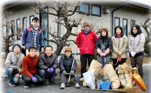
NPO法人 かがやけ安八 百梅園除草ボランティア

これが「令和」の所以たるところです。そこで私たちの「百梅園」ですが、永遠の「百梅園」とすべく、町民ひとり一人が力を合わせ、益々発展させて行きたいものです。