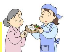
配食サービス・見守り