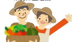
耕作放棄地の活用