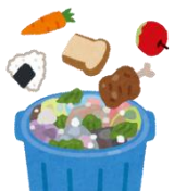
食品ロス削減活動